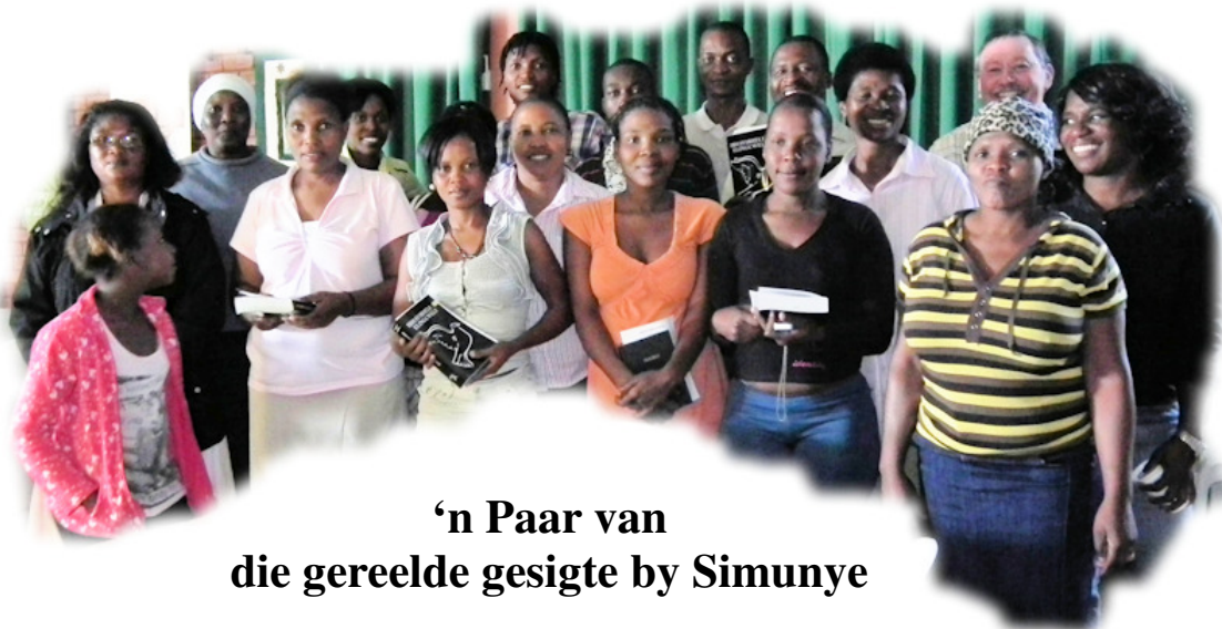
'n Paar van die gereelde gesigte by Simunye

Daar word verversings aangebied, en diegene wat finansiële swaarkry word gehelp met hulle vervoerkoste (sommige is werkloos).